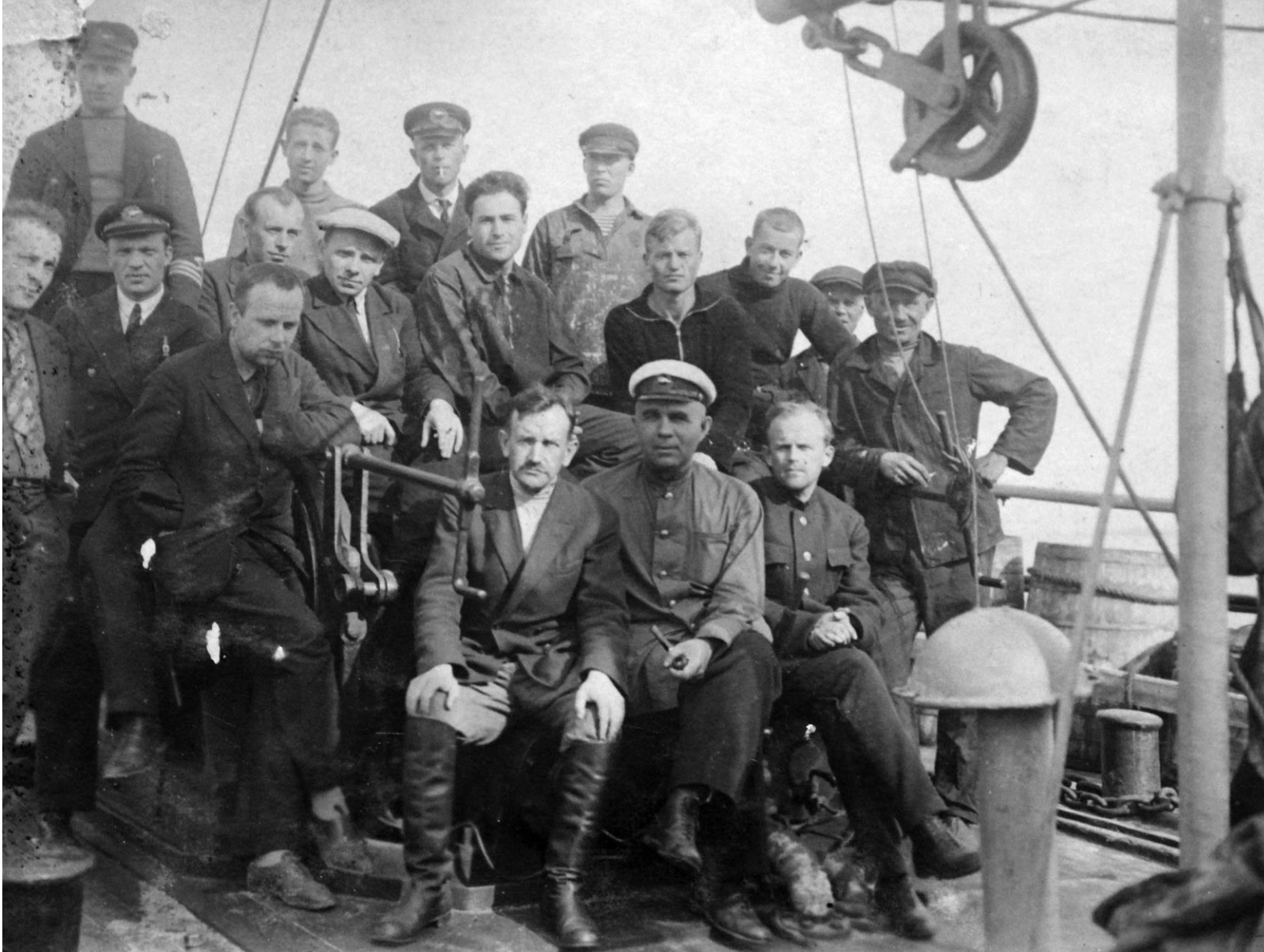
Смена зимовщиков в пути на станцию Бухта Тихая 1934 г.