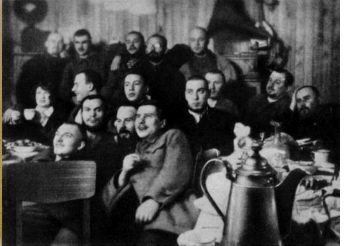
Праздничный новогодний вечер в бухте Тихая.

ПАРТОРГ П/С ТИХАЯ ..... Абрамов, Абрамов/ 31-го октября 1938 года