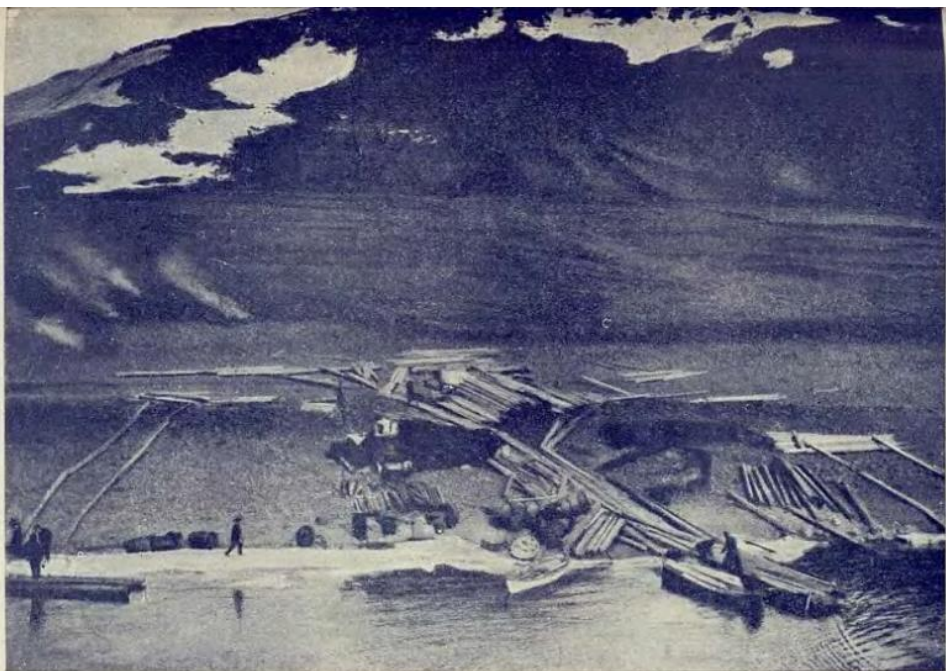
Выгрузка строительных материалов в бухте Тихой.