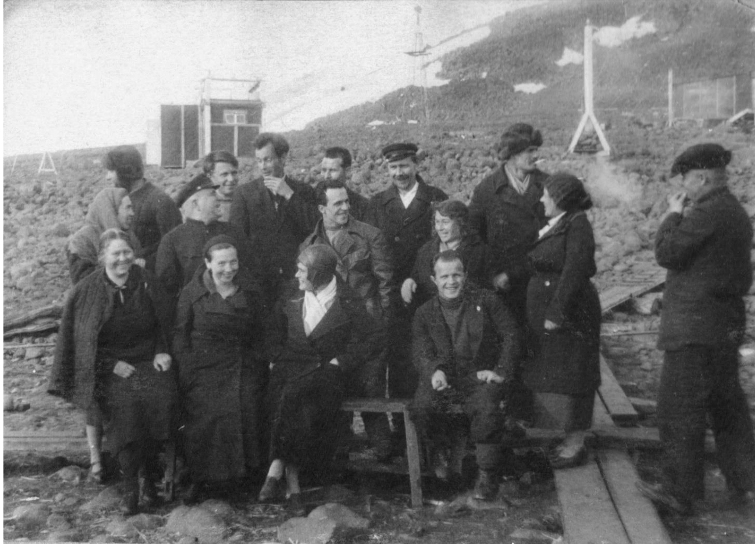
Праздничное общее фото зимовщиков станции Бухта Тихая. 1935-1936 г.