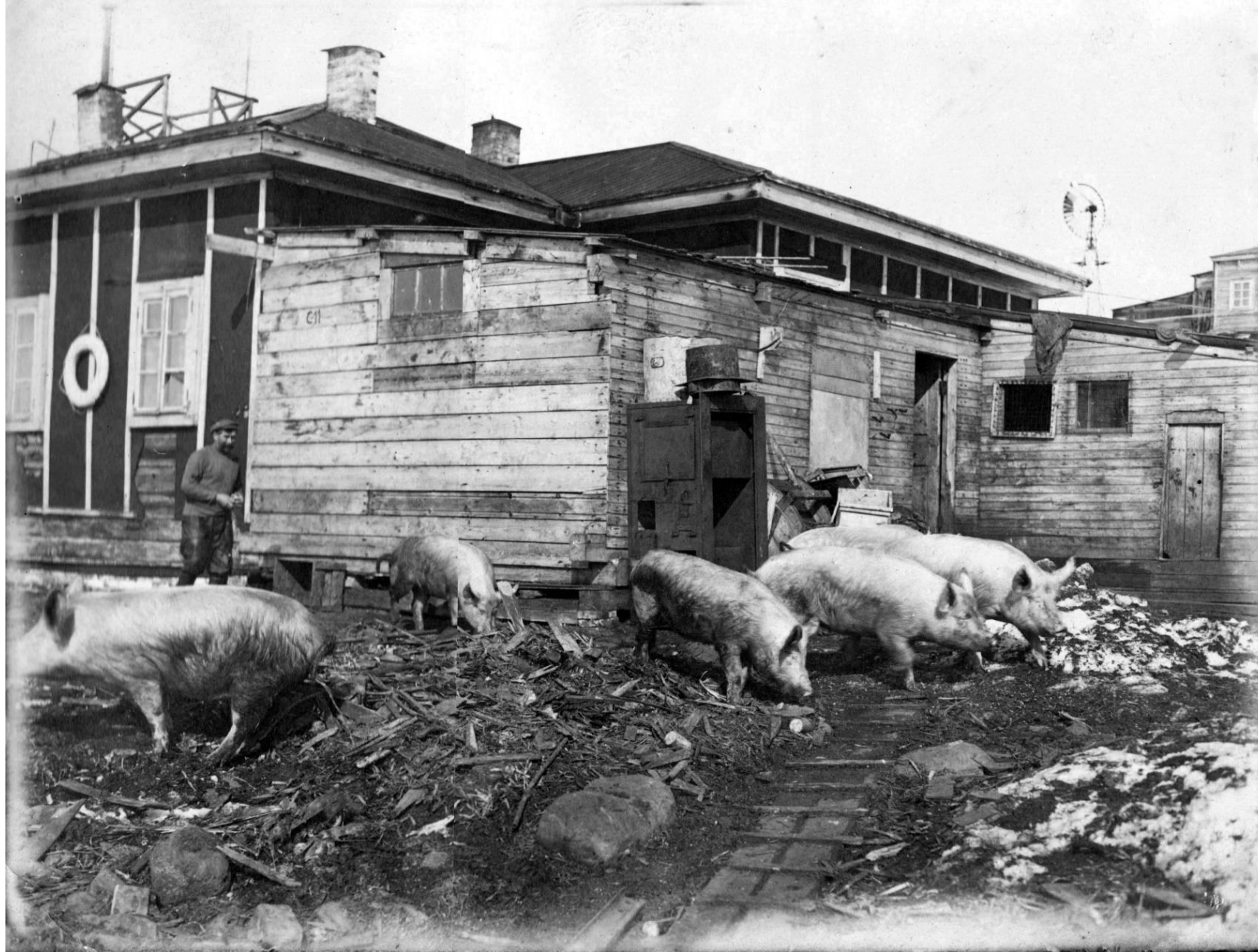
Разведение свиней на станции Бухта Тихая.