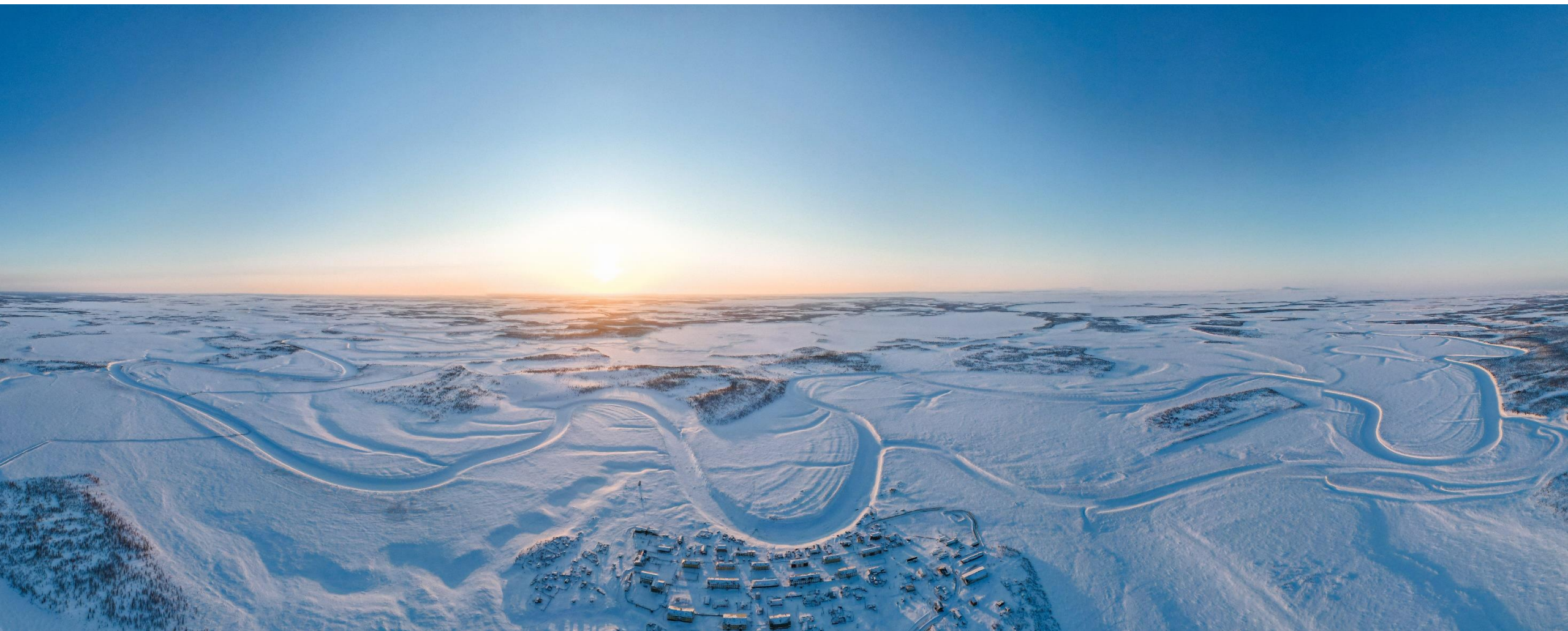
п. Андрюшкино с высоты птичьего полета