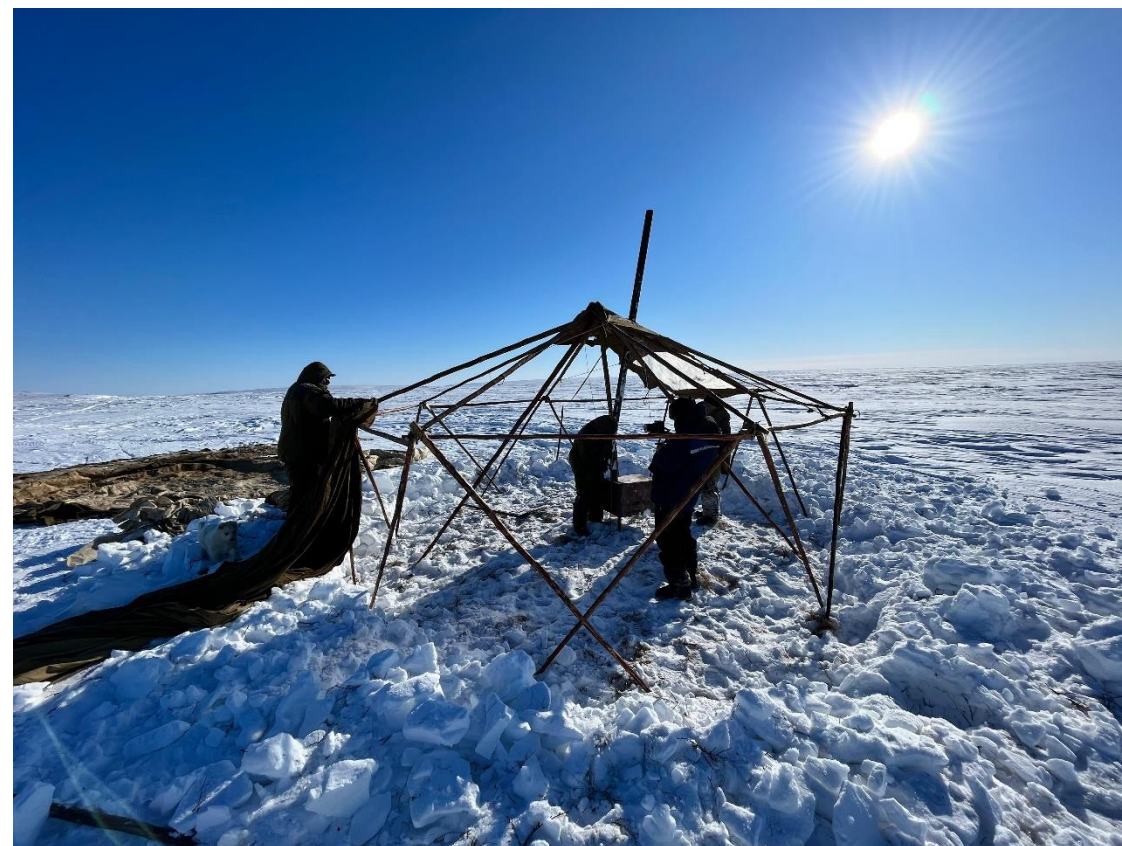
Каркас будущей яранги в Олеринской тундре