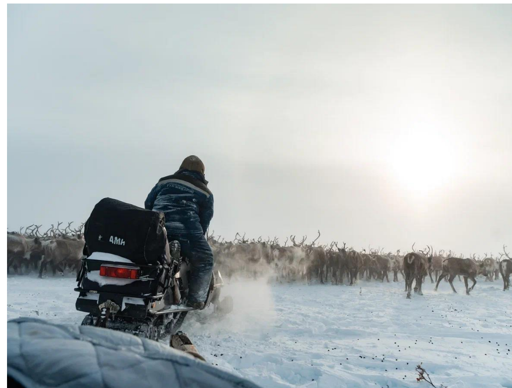
Повседневность Олеринской тундры