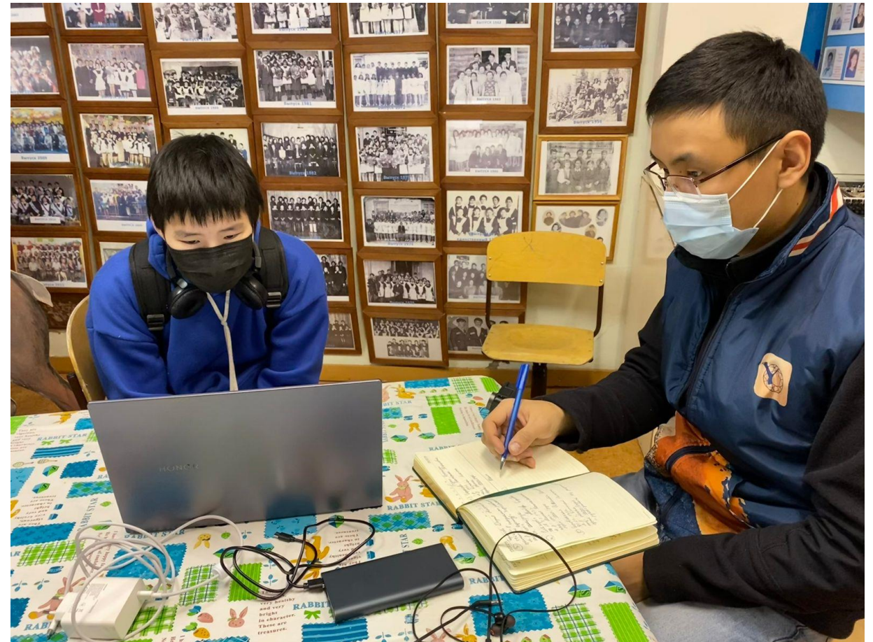
Лингвистический эксперимент в школе п. Саккырыр