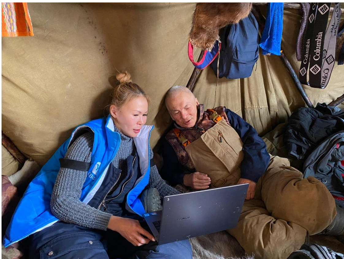
Лингвистический эксперимент юкагиром