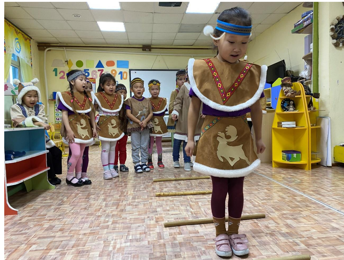
Слет оленеводов в Оленекском эвенкийском национальном улусе