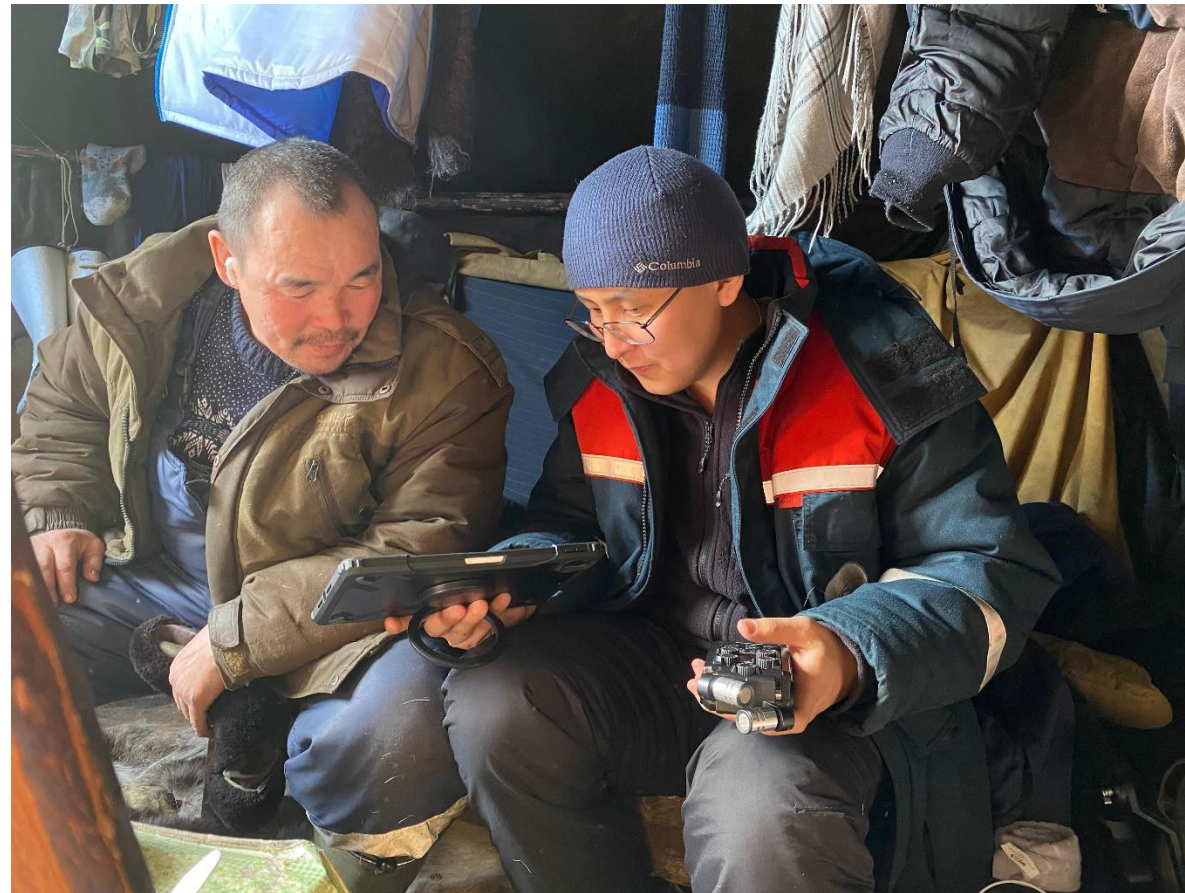
Лингвистический эксперимент с носителем эвенского языка