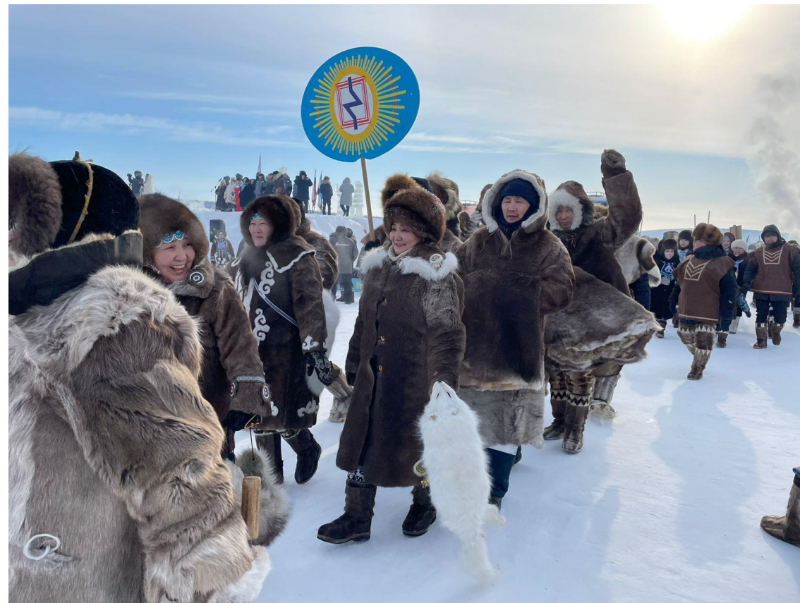
Слет оленеводов в Оленекском эвенкийском национальном улусе