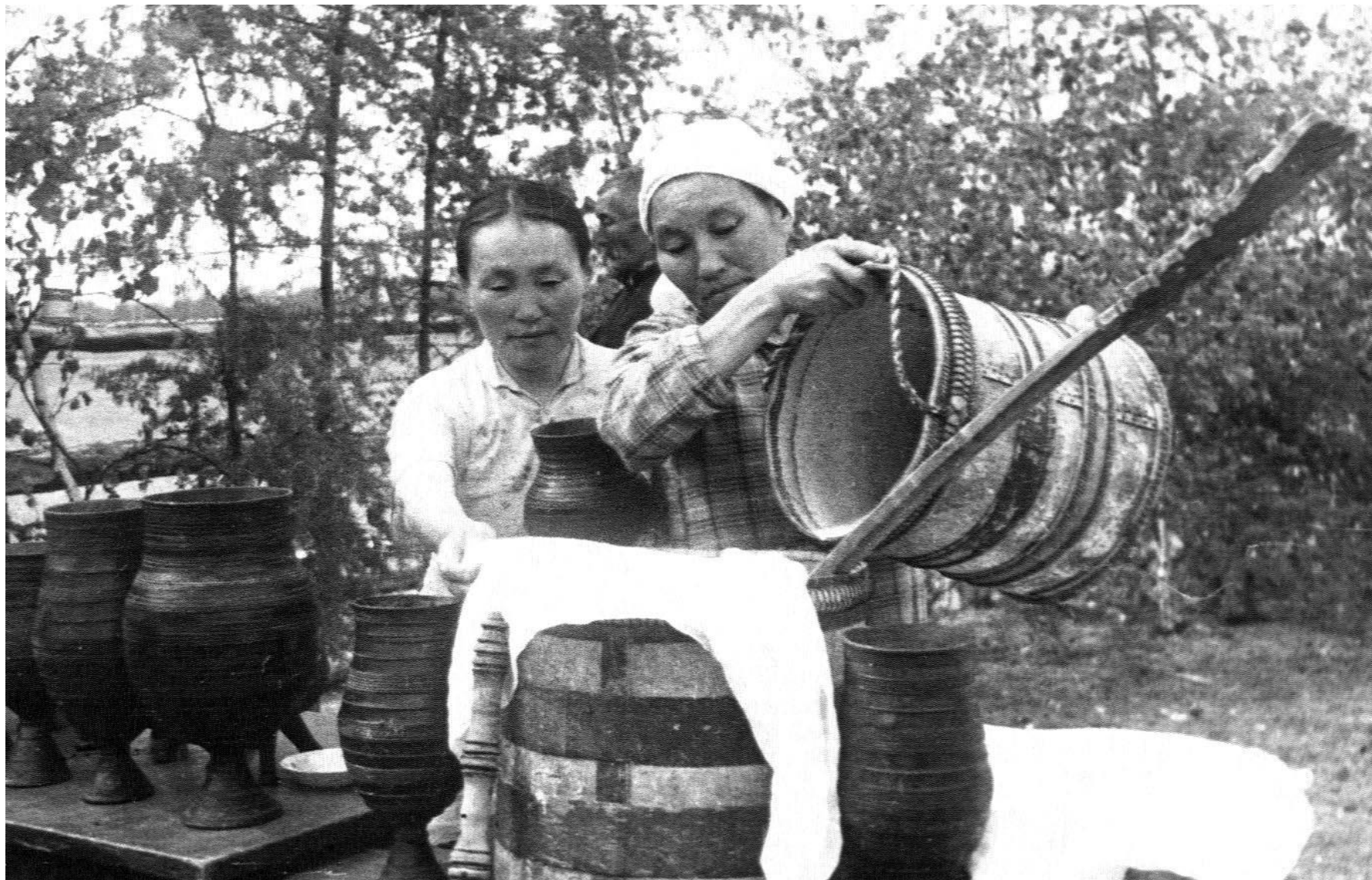
Во время Ысыаха 1945 года. Колхоз «Красный маяк»