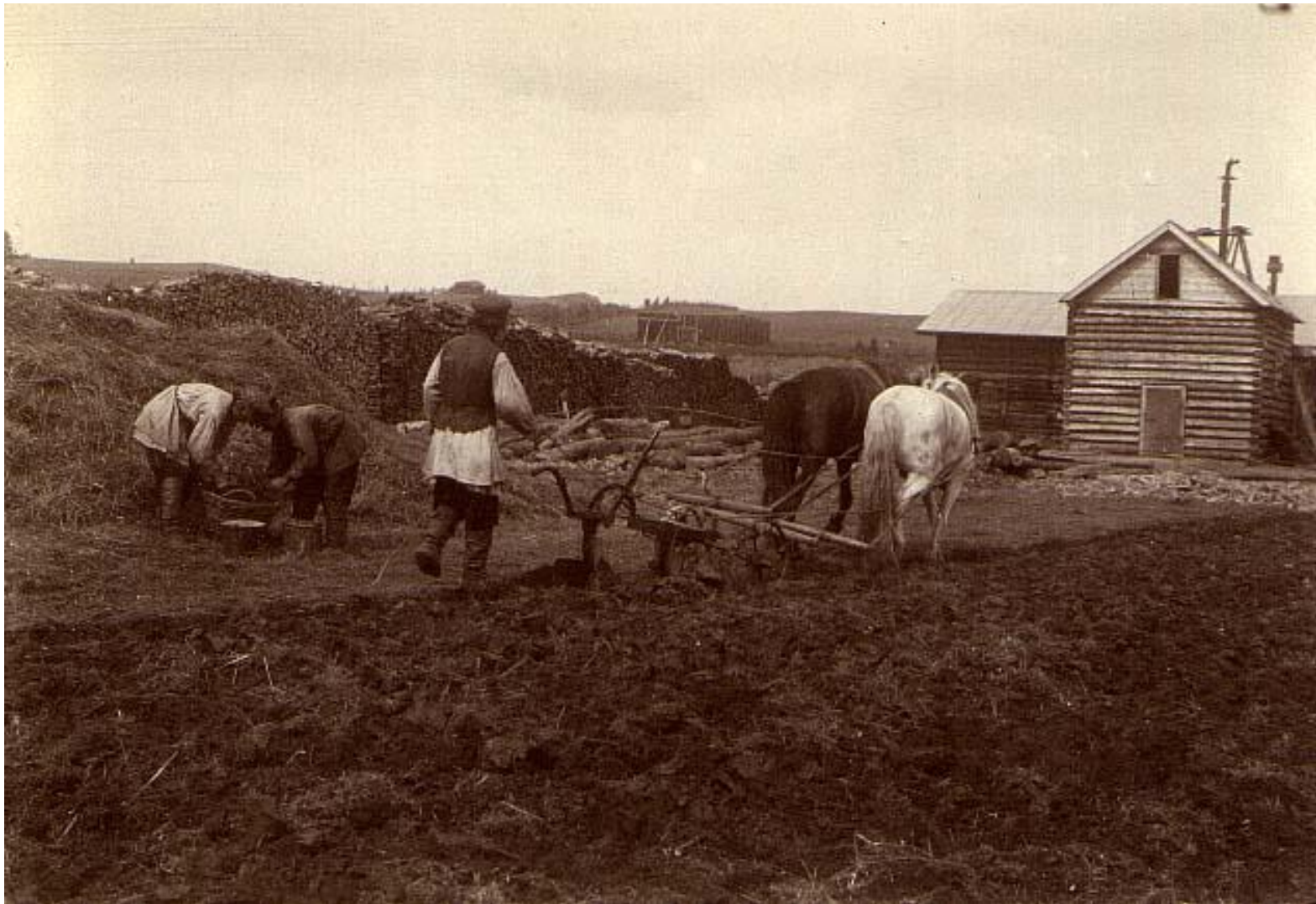
Русские крестьяне на вспашке поля. Начало XX века