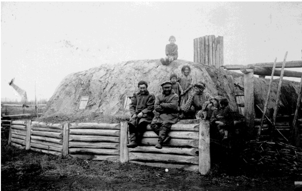
Жилище якутов. Начало XX века