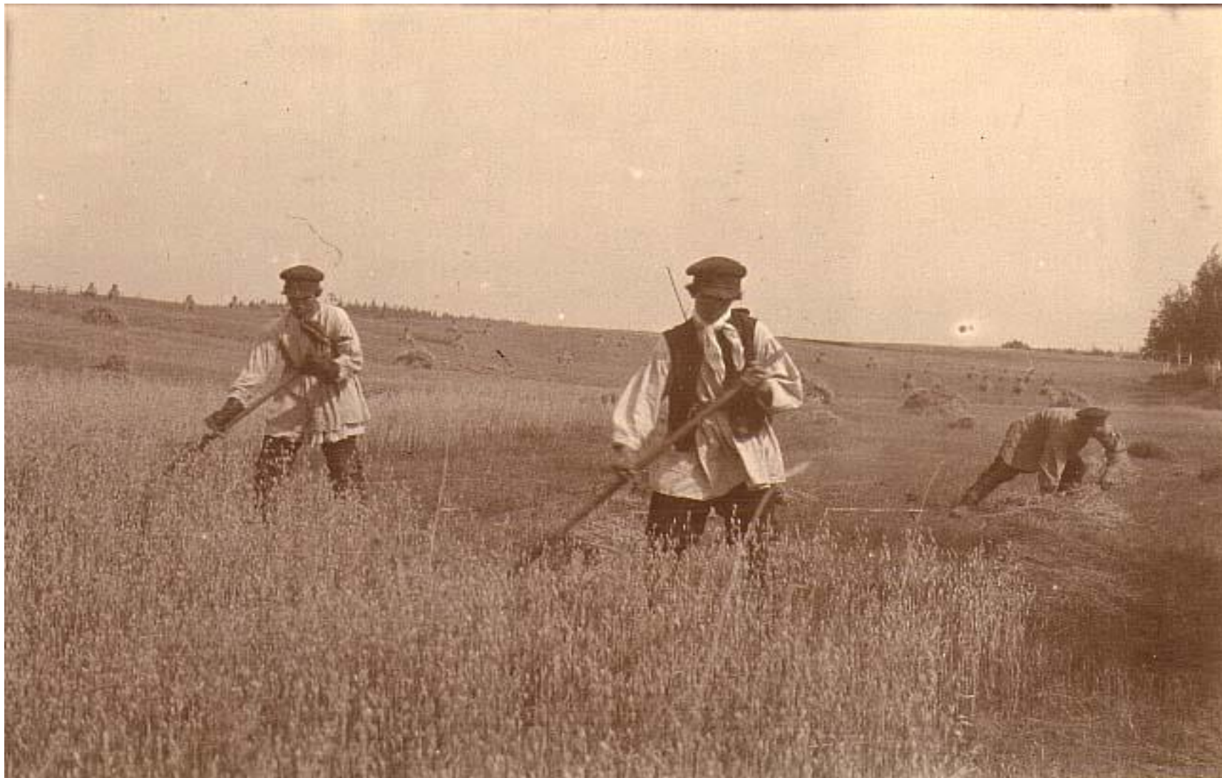
Косари. Начало XX века