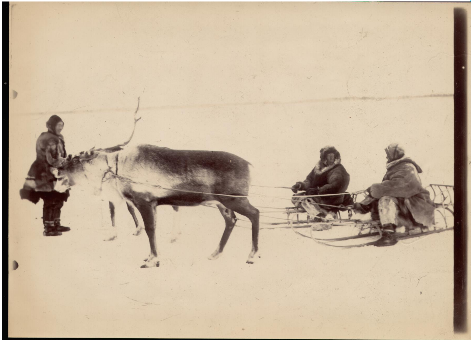
На Севере Якутии. Начало XX века