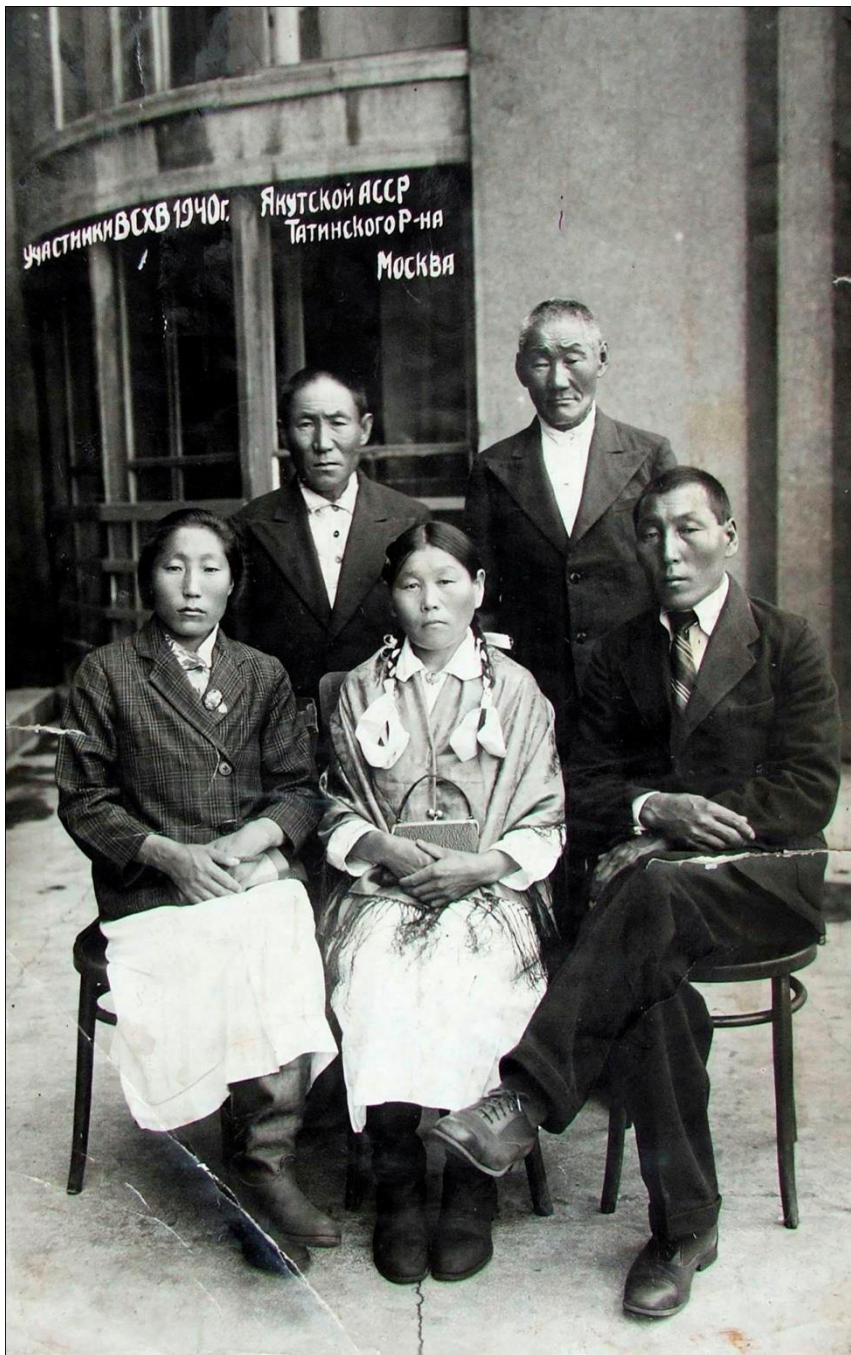
Участники Всесоюзной сельскохозяйственной выставки 1940 года в г.Москве