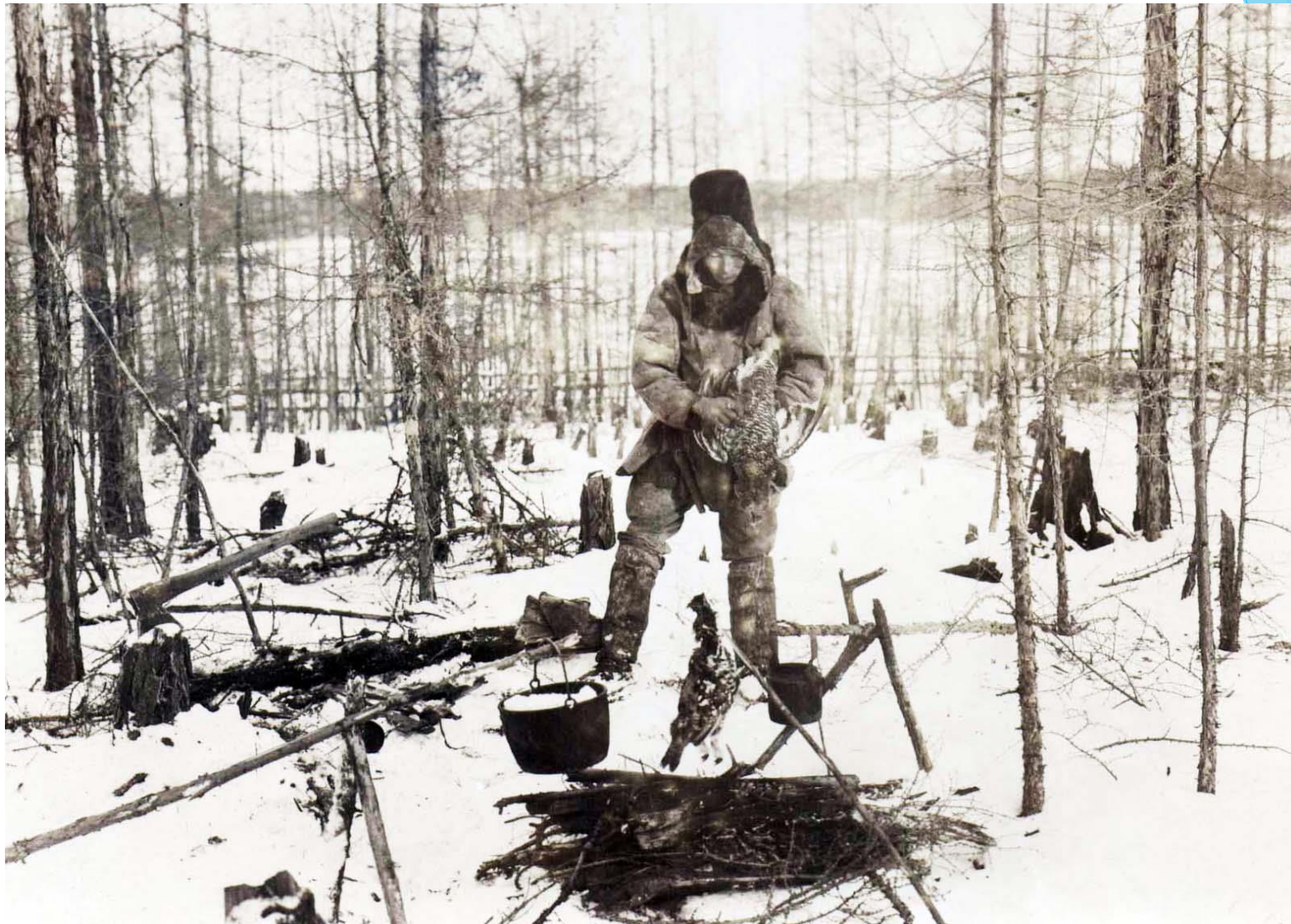
Охотник. Начало XX века