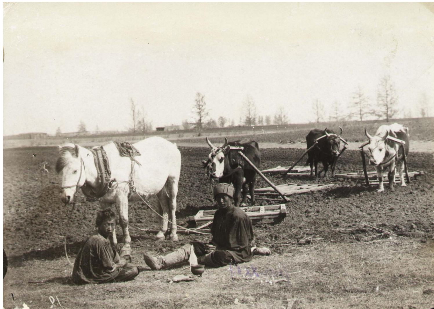
Якуты на пахотных работах. Начало XX века