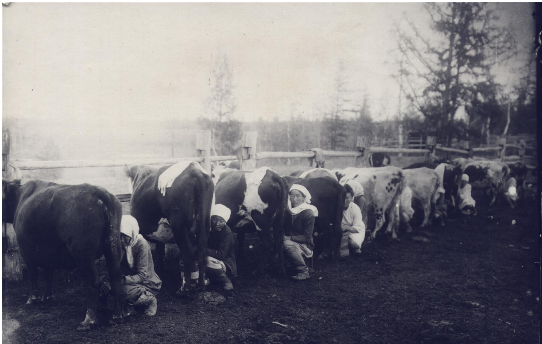
Утренняя дойка. Чурапчинский район ЯАССР. 1930-е годы