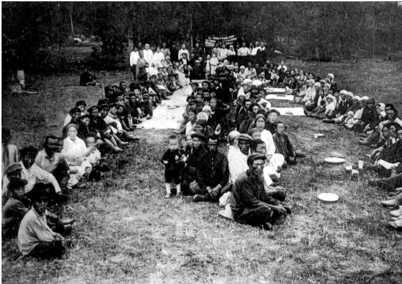
Колхоз «Красное озеро». Праздник годовщины колхоза