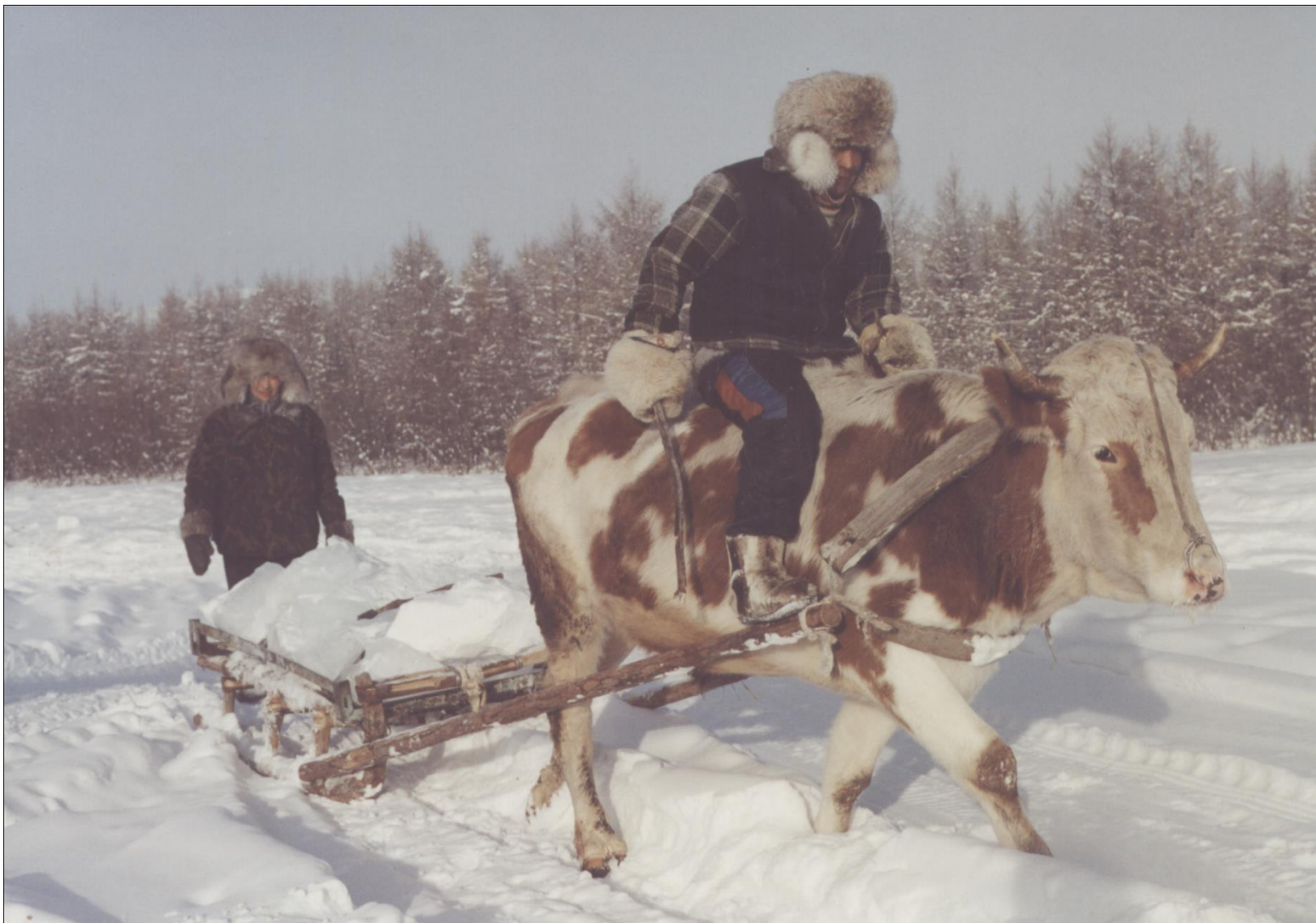
Сельский житель на заготовке льда