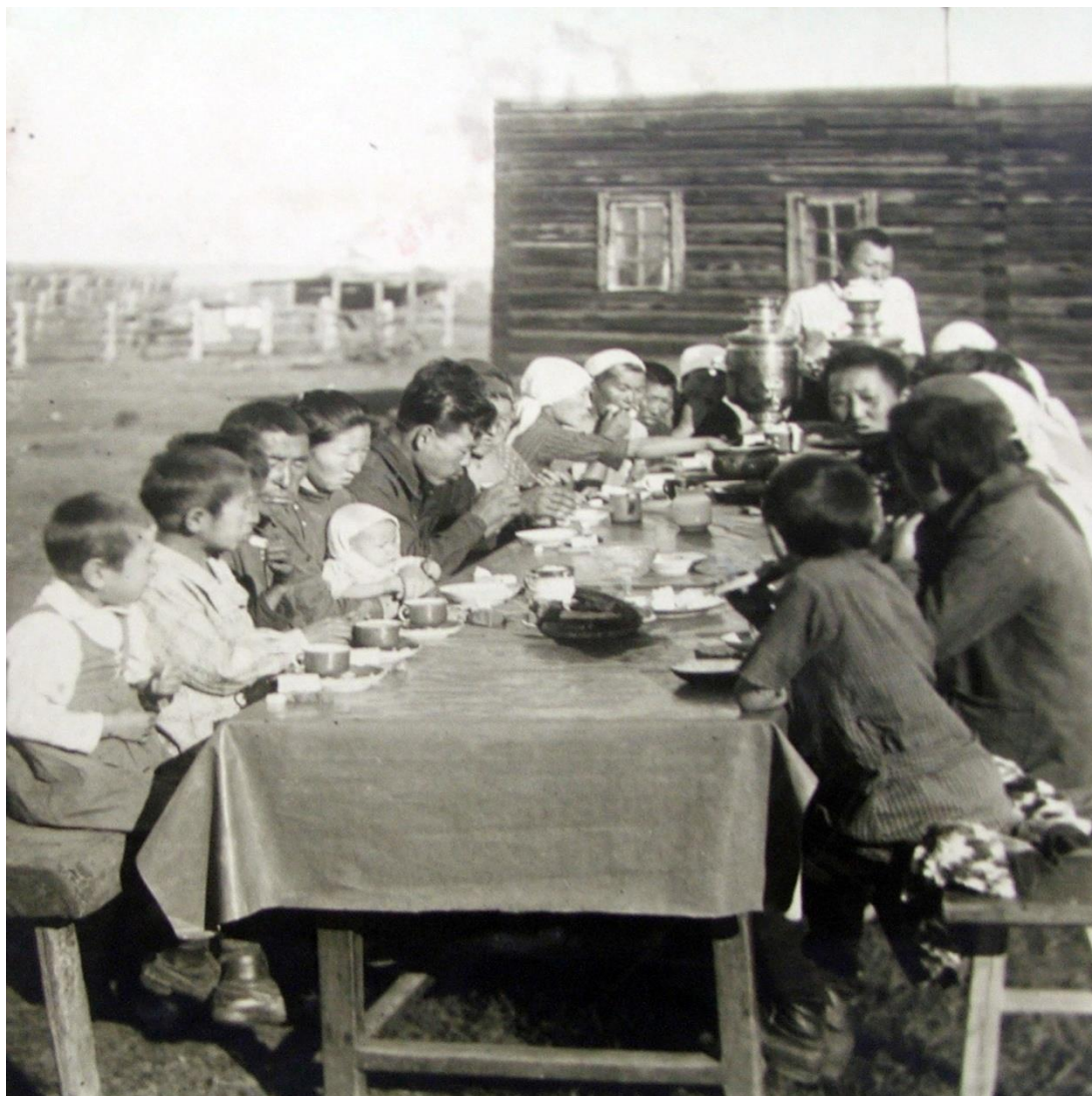
В поселении при ферме