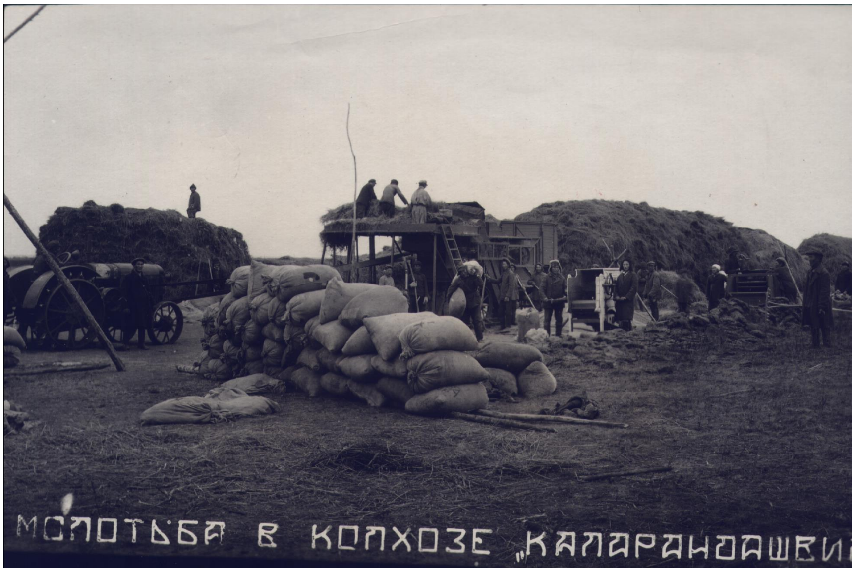
Молотьба в колхозе им. Каландарашвили