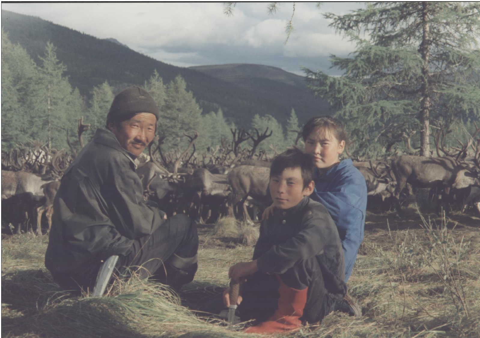
Эвенская семья в оленеводческом стаде. Себян-Кюель Кобяйского улуса