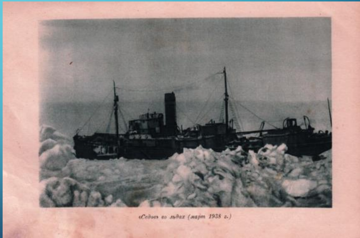
«Седое» во льдах (март 1938 г.)