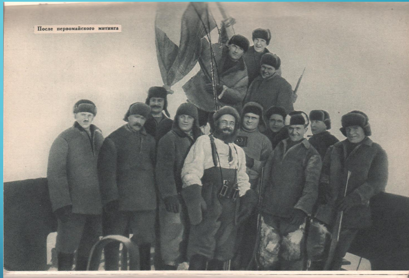
После первомайского митинга