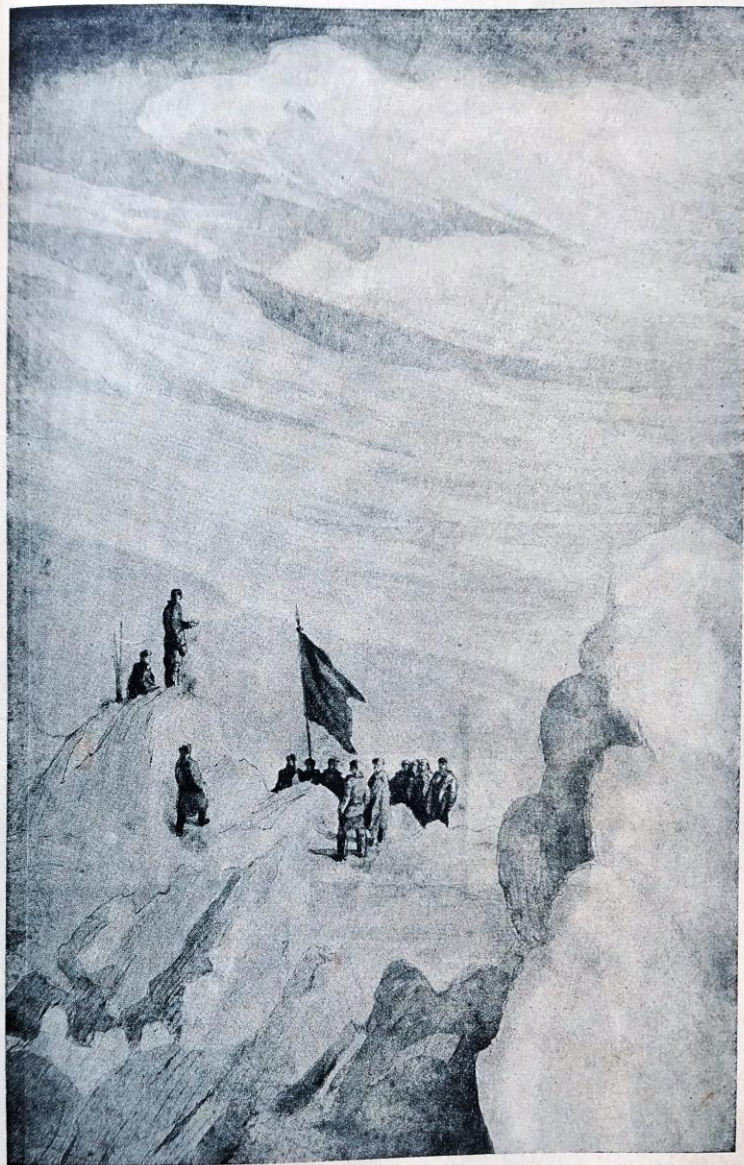
На первомайскую демонстрацию вышел весь маленький экипаж ледокольного парохода...