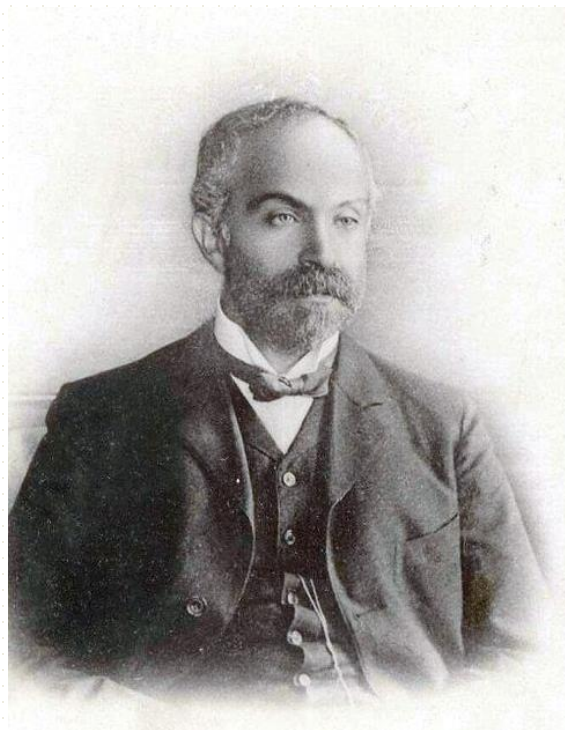
Владимир Германович Богораз