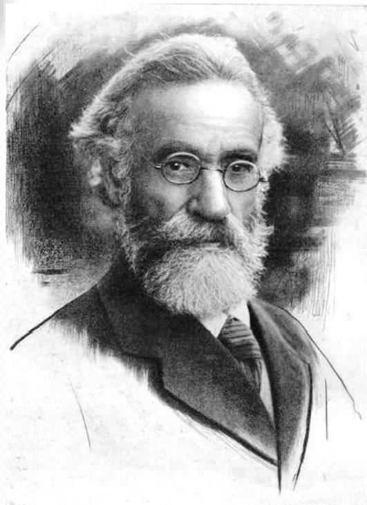
Лев Яковлевич Штернберг