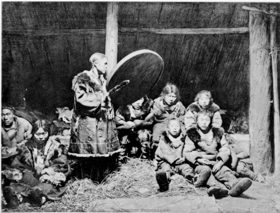
Корякская женщина-шаман.

Владимир Богораз (справа) с женой в Ново-Мариинске готовят к отправке собранную этнографическую коллекцию