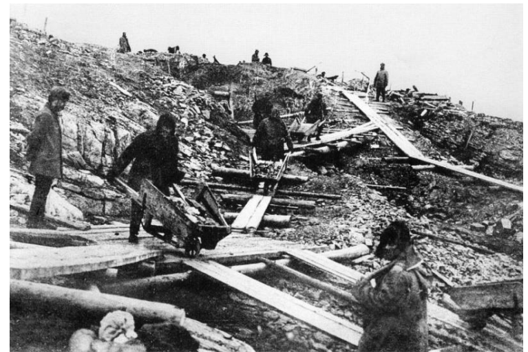
Заклученные в руднике на мысе Раздельный. 1931-32 г.