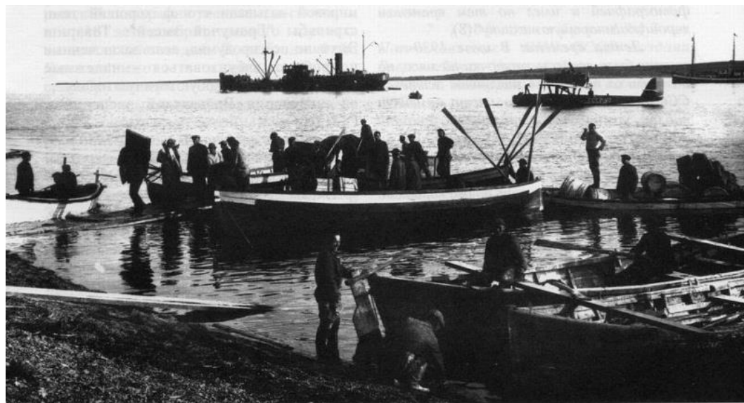
Бухта Варнека. Начало 30-х гг. Слева направо: п/х “Глеб Бокий”, летающая лодка “Комсерверпуть №3”, мотобот “Вайгач”.