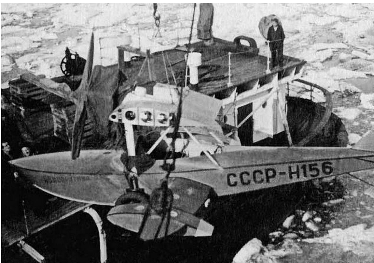
Фото 3. Погрузка ледового разведчика Ш-2 Севморпути на борт ледореза Ф.Литке (1935 г.) 2