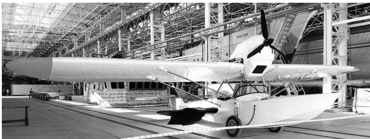
Фото 5. Самолет-амфибия Ш-2.017 бис, за основу при строительстве в качестве прототипа использовался самолет «Ш-2» находящийся в музее Арктики и Антарктики. Сегодня в цехах АО «СНЗ» он готов к летным испытаниям и уже проверен на остойчивость в воде 02.08.2019 г. 3 - https://www.youtube.com/watch?v=Dwelzo76fvE