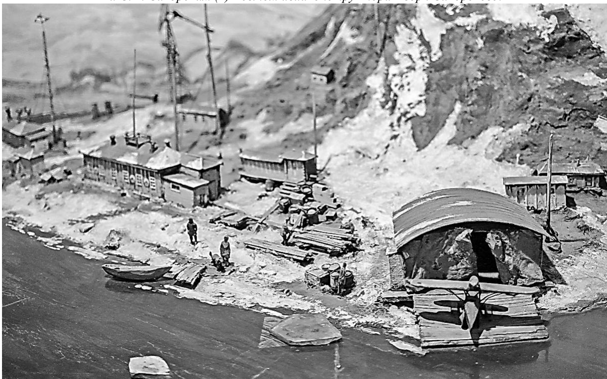
Фото 2. Макет полярной станции в бухте Тихой 1 (ФГБУ "Российский государственный музей Арктики и Антарктики")

Г.П. Гардымовым (1) - директором ФГУП «ЛЕНИНГРАДСКИЙ СЕВЕРНЫЙ ЗАВОД» и С.И. Сикорским (2) - сыном авиаконструктора Игоря Сикорского.