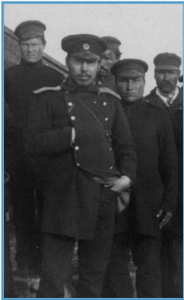
Предполагаемое фото Леонида Францевича Гриневецкого (фото А.А. Бунге, 1889 г., фонды РГБ)

Врач Мало-Кармакульской полярной станции Леонид Францевич Гриневецкий (17 июня 1853 – 22 июня 1891 г., 38 лет)