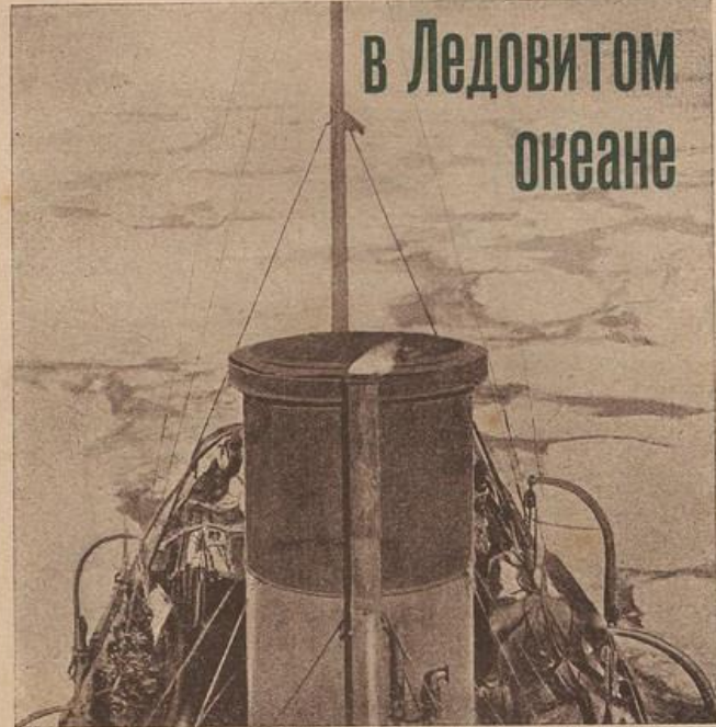
ГИДРОГРАФИЧЕСКАЯ ЭКСПЕДИЦИЯ НА ОСТРОВ ВРАНГЕЛЯ.