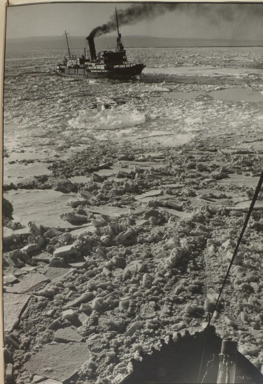
В АРКТИКЕ 1948г.